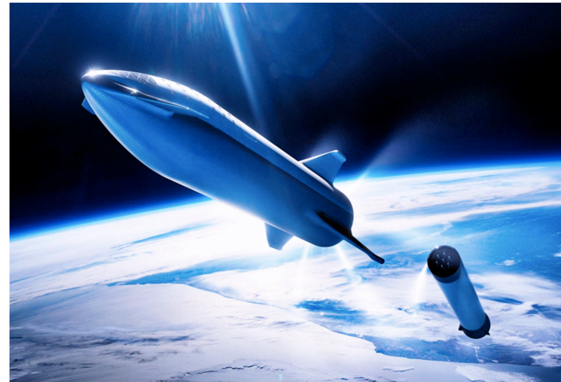
Viajes de turismo a la luna en próximos años